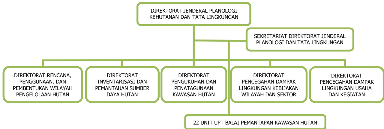
Gambar 3. Struktur Organisasi Ditjen Planologi kehutanan dan Tata Lingkungan