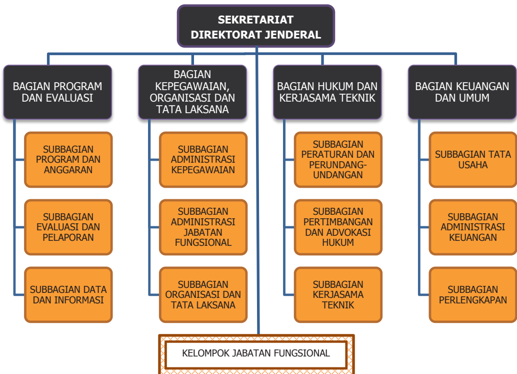
BAGAN 1. STRUKTUR ORGANISASI SEKRETARIAT DIREKTORAT JENDERAL PLANOLOGI KEHUTANAN DAN TATA LINGKUNGAN.

Struktur organisasi Sekretariat Direktorat Jenderal Planologi Kehutanan dan Tata Lingkungan dapat dilihat pada Bagian 1.