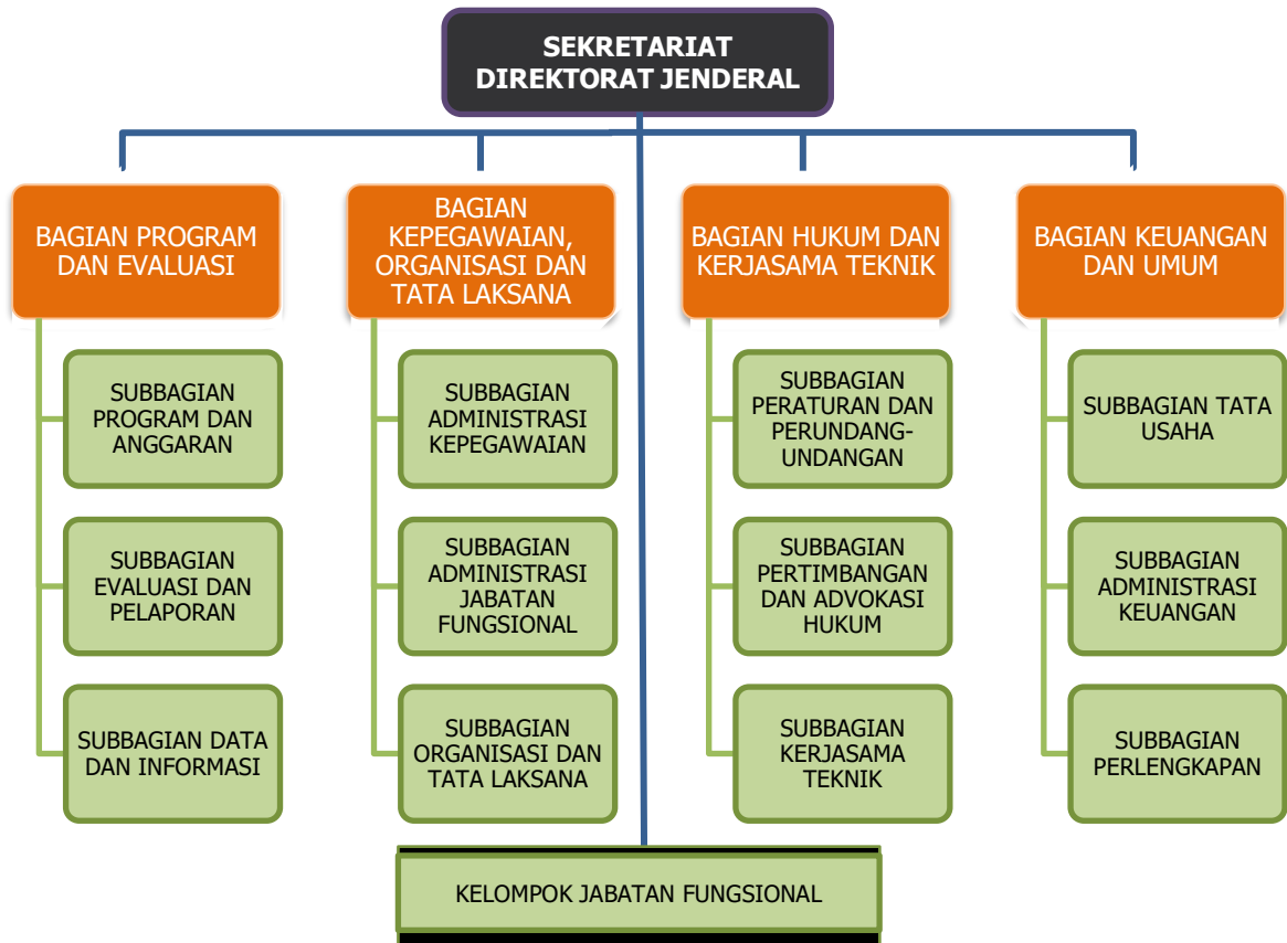
Gambar 1. Struktur organisasi Sekretariat Direktorat Jenderal Planologi Kehutanan dan Tata Lingkungan.

Struktur organisasi Sekretariat Direktorat Jenderal Planologi Kehutanan dan Tata Lingkungan dapat dilihat pada Gambar 1.