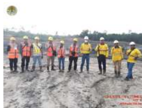
Verifikasi PNBPKH PT Hampan Mulya