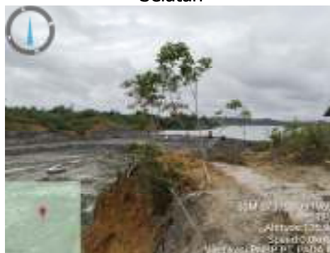
Verifikasi PNBPKH PT Pada Idi