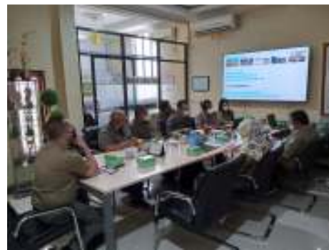
Supervisi Verifikasi Pembayaran PNBPKH di Kalimantan Tengah