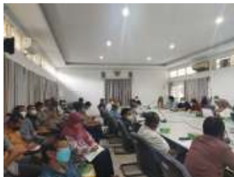
Monitoring dan Supervisi Verifikasi Pembayaran PNBPKH di Kalimantan Selatan